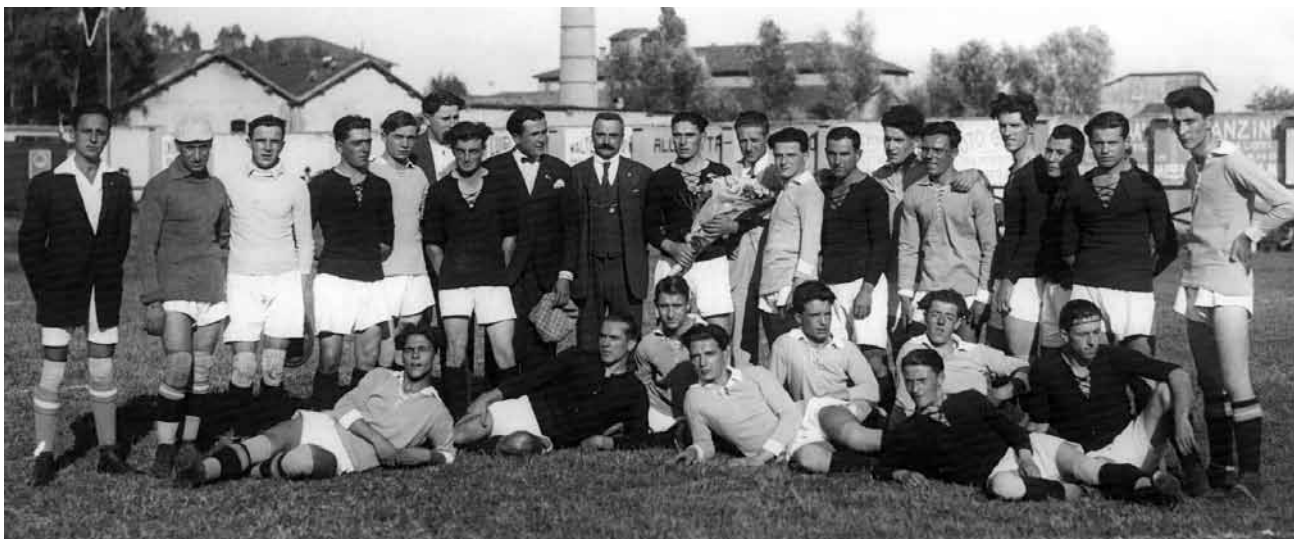
Foto di gruppo tra le squadre della Reggiana e del Mantova che si fronteggiano il 23 settembre del 1923 al Mirabello.