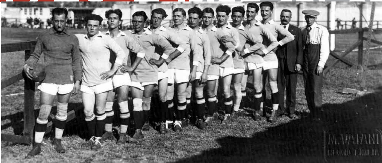
La squadra del Mantova che impatta al Mirabello per 5 a 5 con la Reggiana nella partita amichevole che si svolge il 23 settembre 1923.