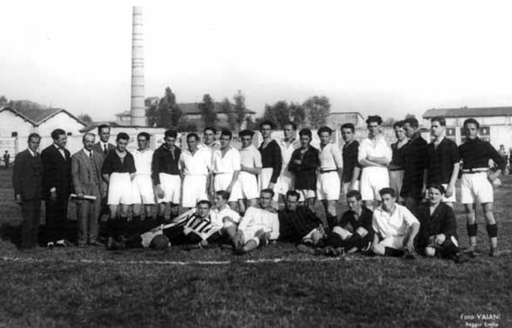
Foto di gruppo, il 23 agosto al Mirabello, tra le squadre della Reggiana (in maglia bianca) e una formazione mista con la quale i granata giocano per presentare i nuovi acquisti.

La squadra del Legnano, che batte la Reggiana per 1 a 0 nella partita pre-campionato che si svolge il 16 settembre del 1923 al Mirabello.